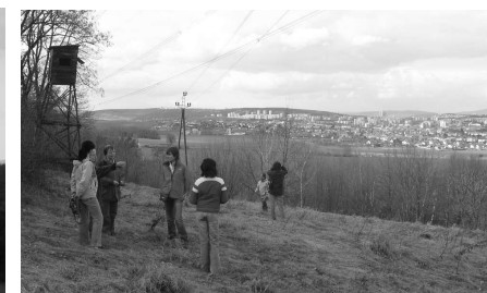
Nový Lískovec a Bohunice ze severního svahu

Po cestě podél keři zarostlé hormí hrany svahu pokračujeme směrem k Modřicím. Kousek za mysliveckým posedem, vyrobeným z části bývalé hasičské věže, se vlevo naskytne volnější prostor pro výhled. To je asi místo, kde je v konceptu Územního plánu navržena rozhledna. Ani by to nemusela být věž, ale stačila by plošina na podpěrách, vysunutá pár metrů ze svahu - a zajistila by téměř 180-stupňový rozhled, jsme totiž pořád na převýšení kolem 100 m nad řečištěm Svratky a tedy dnem brněnské kotliny.