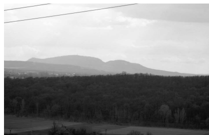
Silueta pálavských kopců

Na konci sadů máme před sebou plot a za ním vidíme budovy drůbežárny a v dálce Kohoutovice (415m, asi 8 km). Před plotem zahne doprava a v koutě (5) se cesta otáčí zpět k Modřicím. V zimě nebo na jaře se dá projít řídkým akátovým lesíkem na jeho okraj k mysliveckému posedu pod elektrickým vedením, odkud jsou zajímavé pohledy na Moravany, Lískovec i Brno. Do lesíka se kdysi děti z modřické školy chodily dívat na balvany bílých křemenů a na severním svahu k Brnu se v několika rýhách těžil hadec, používaný i jako kámen v ulicích. V létě a na podzim, jsou však dnes tato místa díky bujně vegetaci prakticky nepřístupná..