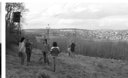
Nový Lískovec a Bohunice ze severního svahu

Po cestě podél keři zarostlé hormí hrany svahu pokračujeme směrem k Modřicím. Kousek za mysliveckým posedem, vyrobeným z části bývalé hasičské věže, se vlevo naskytne volnější prostor pro výhled. To je asi místo, kde je v konceptu Územního plánu navržena rozhledna. Ani by to nemusela být věž, ale stačila by plošina na podpěrách, vysunutá pár metrů ze svahu - a zajistila by téměř 180-stupňový rozhled, jsme totiž pořád na převýšení kolem 100 m nad řečištěm Svratky a tedy dnem brněnské kotliny.