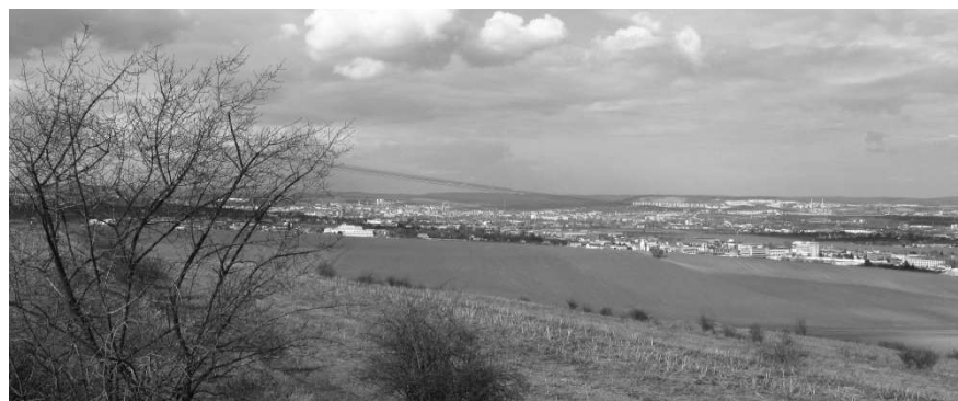
Tady by mohla být vyhlídková plošina

Po cestě podél keři zarostlé hormí hrany svahu pokračujeme směrem k Modřicím. Kousek za mysliveckým posedem, vyrobeným z části bývalé hasičské věže, se vlevo naskytne volnější prostor pro výhled. To je asi místo, kde je v konceptu Územního plánu navržena rozhledna. Ani by to nemusela být věž, ale stačila by plošina na podpěrách, vysunutá pár metrů ze svahu - a zajistila by téměř 180-stupňový rozhled, jsme totiž pořád na převýšení kolem 100 m nad řečištěm Svratky a tedy dnem brněnské kotliny.